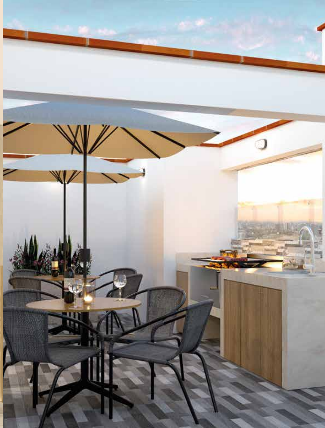
Zona de parrillas/Terraza